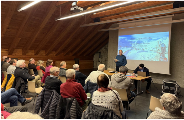
Simplon Tourismus GV