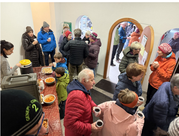
2. Adventsfenster Dorfladu