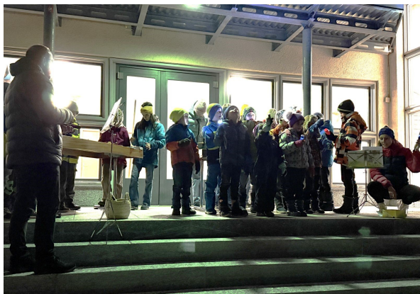
1. Adventsfenster Schulhaus