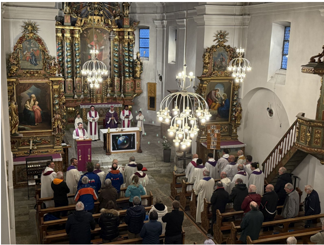
Messfeier mit Bischof Lovey