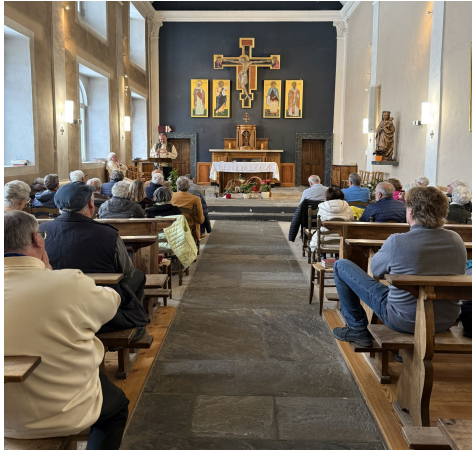
Erinnerung Papst Gregor 750 Jahre